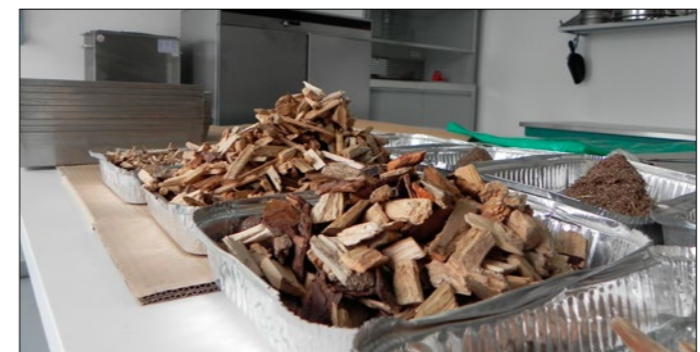
Laboratorij za lesno biomaso na Gozdarskem inštitutu

V kotlovnici je nameščena tudi naprava za spremljanje emisij dimnih plinov (SWG 200). Naprava omogoča kontinuirano spremljanje emisij O 2 , CO, NO, NO 2 in SO 2 . Meritve v prvi kurilni sezoni so pokazale, da kakovost