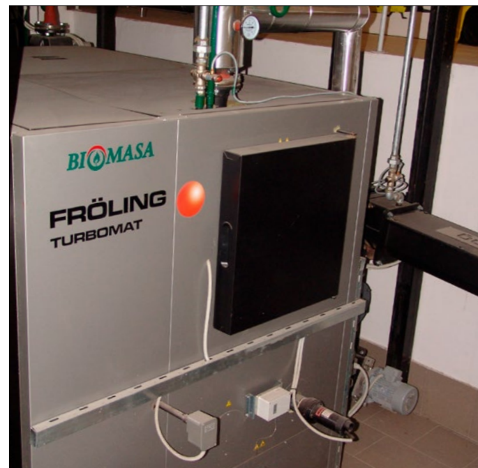
Kotel na lesne sekance proizvajalca Fröling

Kompleks Gozdarskega inštituta Slovenije, kjer imata poleg Gozdarskega inštituta Slovenije svoja sedeža še Zavod za gozdove Slovenije ter Oddelek za lesarstvo - Biotehniške fakultete, leži na Večni poti 2, v bližini parka Tivoli, pod hribom Rožnik in v neposredni bližini stanovanjske soseske.