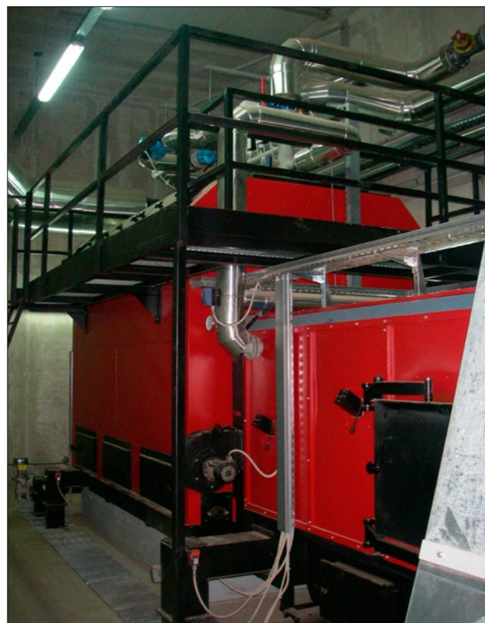
Kotel na lesne sekance

Investitor v kotlovnico je podjetje samo, ki ima z dobaviteljem kotla podpisano pogodbo o servisiranju in podpori, medtem, ko za redno vzdrževanje skrbijo sami. Veriga dobave sekancev se v podjetju prepleta s podjetjem, ki je večji proizvajalec sekancev v Sloveniji in deluje v regiji. GG NM podjetju dobavlja in prodaja lesno biomaso iz gozdarske proizvodnje, dobavitelj sekancev pa podjetju nato prodaja sekance. Cena in kvaliteta sekancev (G30 vsebnost vode 45 %) sta dogovorjeni. Poleg teh sekancev GG NM uporablja še sekance, ki nastanejo ob proizvodnji tramov. Dostava sekancev v zalogovnik poteka tedensko s tovornjaki s prilagojenimi prikolicami kapacitete 40 nm 3 . Na letnem nivoju tako v kotlovnici porabijo okvirno 3.500 nm 3 sekancev.