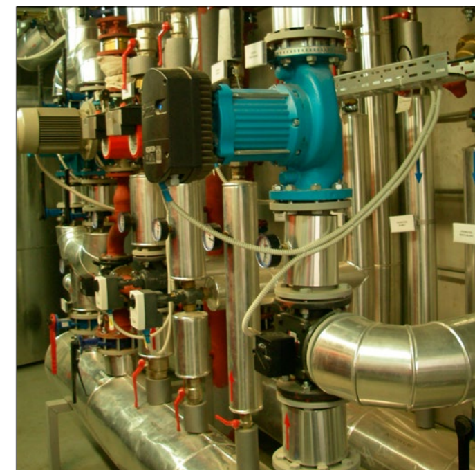
Sistem vodnih črpalk

Osnovno vzdrževanje kotla, kot je čiščenje toplotnega izmenjevalca ter ciklona dimnih plinov, opravljajo sami. Druge servisne storitve pa po pogodbi opravlja proizvajalec kotla.