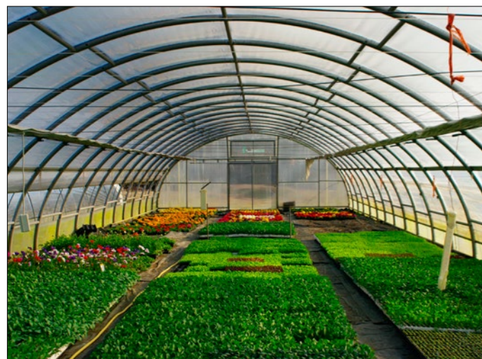
Rastlinjak v podjetju Gozdno gospodarstvo Novo mesto

Danes je glavna dejavnost podjetja izvajanje koncesije v državnih gozdovih. Za potrebe koncesije in trga izvajajo sečnjo in spravilo gozdnih sortimentov, izdelavo in vzdrževanje vlak ter gozdnogojitvena in varstvena dela. Poleg drugih stranskih in pomožnih dejavnosti se ukvarjajo tudi s predelavo lesa ter proizvodnjo in prodajo vrtnarskih proizvodov. Ravno raba lesne biomase za potrebe vrtnarske proizvodnje je vzrok, da predstavljamo GG Novo mesto, kot primer dobre prakse.